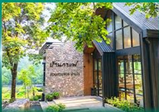
ร้านกาแฟ สวนสวย 168