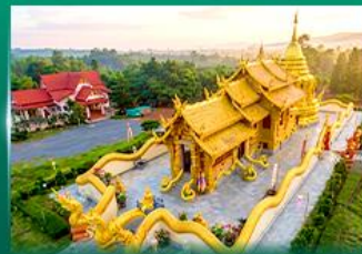
วัดเทพนิมิตประดิษฐ์