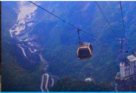
กระเช้าขึ้นเขายเทียนเหมินซาน