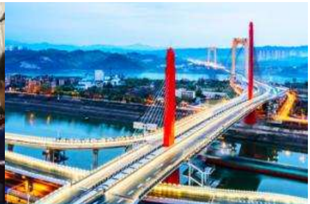
เมืองหยีชาง