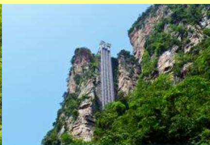
ลิฟท์แก้วไปหลาง