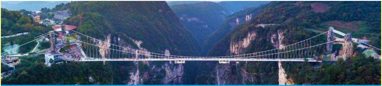
สะพานกระจากข้ามหุบเขาแกรนด์แคนยอน

โปรแกรมเสริมที่ 3 โปรแกรมเที่ยวชมสะพานกระจกร้อมหุบเขาแกรนด์แคนยอนจางเจียเจีย (ผู้เข้าร่วม ขั้นต่ำ 15 ท่าน) ใช้เวลาประมาณ 2-3 ชั่วโมง (ขึ้นอยู่กับจำนวนนักท่องเที่ยวในแต่ละวัน) อัตราค่าบริการ ท่านละ 400 หยวนหรือ 2,000 บาท นำท่านเที่ยวชมสะพานกระจกที่สร้างร้อมหุบเขาที่ยาวที่สุดในโลก ทำทหายความกล้าของท่านด้วยการเดินบนพื้นกระจกไสที่สามารถมองเห็นก้นเหวลึกที่อยู่เบื้องล่าง....อัตรา ค่าบริการรวม ค่าบัตรเข้าอุทยาน ค่ารถรับส่งภายในเขตอุทยาน ค่าน้ำดื่มของไกด์ท้องถิ่น