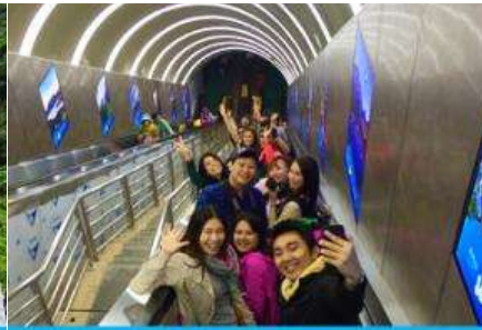
บันไดเลื่อนทะลุภูเขา