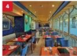
Hot Pot Enjoy your favourite noodles with an extensive list of beverages available to complement your dinner.