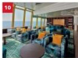
Palm Court Relax in our sophisticated observatory lounge as you enjoy sweeping ocean views.