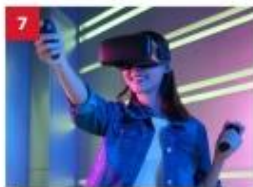
ESC Experience Lab Experience the latest in virtual and augmented reality technology for non-stop thrills.