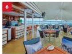
Seafood Grill Enjoy your favourite outdoor hot pot dining with a wide selection of meats, seafood or vegetarian options, paired with an extensive beverage list.