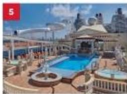
Parthenon Pool Go for a dip in our outdoor Roman-themed pool deck with Caesar's Slide, hot tubs, a stage for live bands and a mega LED screen.