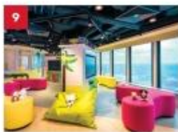
Little Dreamers Club Feed your children's imaginations with games, workshops, costume parties and even a DJ booth at our kids-only club.