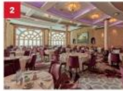
Dream Dining Room Savour Chinese and Western cuisine in our elegant main inclusive dining room.