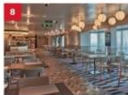
Mozzarella Ristorante & Pizzeria For adventurous foodies, savour a modern fusion of classic Italian dishes and pizzas with a Japanese twist.