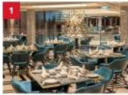
The Palace Enter a world of exclusivity with spacious suites, luxurious facilities and European-style butler service.