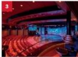
Zodiac Theatre Catch a signature production live show in our opulent theatre.