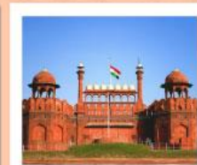
♥♥♥ Agra Fort