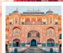
♥♥♥ Amber Fort