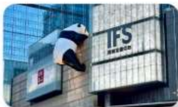
แพนด้าป็นตัก IFS