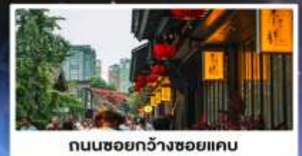
ถนนชอยกว้างชอยแคบ