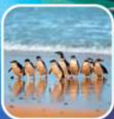
เพนกวินที่เกาะฟิลลิป