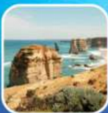
Great Ocean Road (ครึ่งสาย)