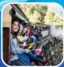
รถไฟจักรไอน้ำโบราณ