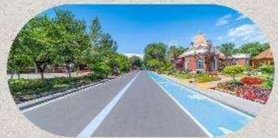
หมู่บ้านโบราณอุยกูร์คาจันจี