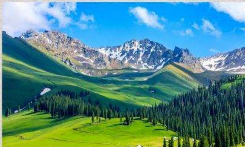
ทุ่งหญ้านาลากี