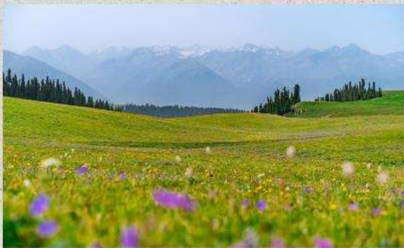
ทุ่งหญ้าคารา