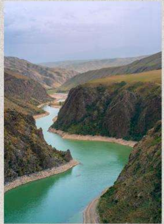
แกรนด์แคนยอนคูโคซู