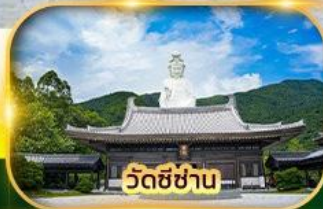
วัดชีซาน