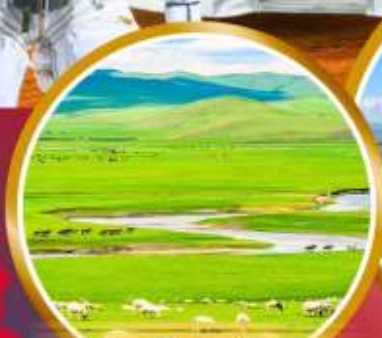
ทุ่งหญ้าออร์โดส

พิเศษ!!! สวมชุดของโทเลีย บนกระโจมของโทเลีย