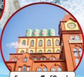
โรงงานเบียร์ซิงเต่า