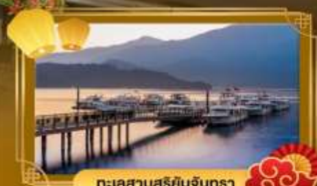
ทะเลสาบสุริยอินจินตรา