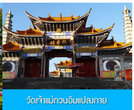
วัดเจ้าแม่กวนอิมแปลงกาย