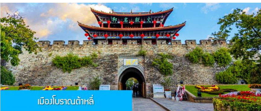
เมืองโบราณต้าลี่

พักที่ DALI ZHUANG YUAN HOTEL ระดับ 4 ดาวหรือเทียบเท่าในเมืองต้าลี่