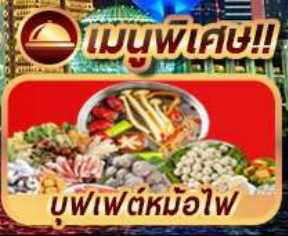
เมนูพิเศษ!! บุฟเฟ่ต์หม้อไฟ