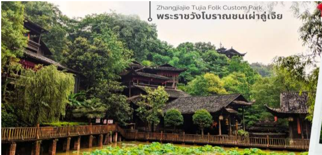
Zhangjiajie Tujia Folk Custom Park พระราชวังโบราณชนเผ่าตู่เจีย

นำทุกท่านเดินทางสู่ พระราชวังโบราณของชนเผ่าตู่เจีย เป็นสถานที่ท่องเที่ยวที่สำคัญในเมืองจางเจียเจีย ประเทศจีน ซึ่งเป็นที่อยู่อาศัยของชนเผ่าตู่เจีย. ภายในพระราชวังมีการแสดงวิถีชีวิต พิธีกรรม และวัฒนธรรมของชนเผ่าตู่เจีย. นอกจากนี้ยังมีอาคาร 9 ชั้นที่สร้างจากไม้ ซึ่งเป็นที่พำนักของเจ้าเมืองในอดีต ซึ่งปัจจุบัน สามารถขึ้นไปชมได้ แต่ละชั้นจะมีแสดงเสื้อผ้าของใช้ของฮ่องเต้ รวมถึงของพื้นเมืองให้เราดู ด้านบนสุดเห็นวิวเมืองด้วย สวยงาม และด้านหลังยังมีอาหารใหม่ที่สร้างหลังอาคารใหญ่ๆ จะมี 2 อาคาร มีบ่อน้ำตามีหลักฮวงจุ้ย