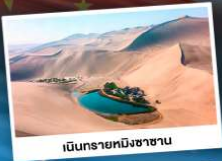
เนินทรายหมิงซาซาน