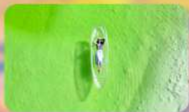
ทะเลสาบเกลืออาเอ๋อร์ซัน