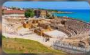
เมืองตรีร์ราโกนา