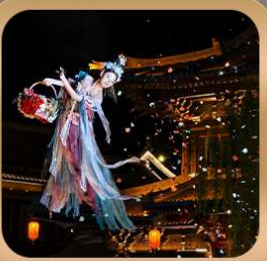
“เมืองโบราณลั่วอี้”