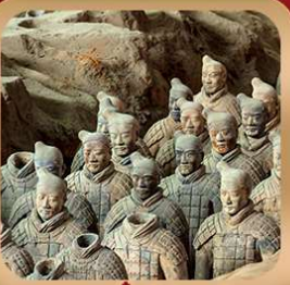
“สุสานจีนซีฮ่องเต้”