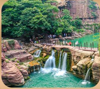
“อุทยานหยุนไท่ซาน”

ชมถ้ำหลงเหมิน มรดกโลกที่เมืองลั่วหยาง • สุสานจีนซีฮ่องเต้ • ศาลเจ้ากวนอู วัดเส้าหลิน + ป่าเจดีย์ + ชมโชว์กังฟู • เมืองโบราณลั่วอี้ • อุทยานหยุนไท่ซาน เจดีย์ห่านป่าใหญ่ • ถนนวัฒนธรรมต้าถัง • ถนนคนเดินอิสลาม • จัตุรัสหอระฆัง