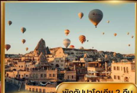
พักคิปปาโดเกีย 2 คืน