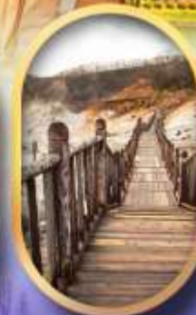
หุบเขาจิกุกดาบิ