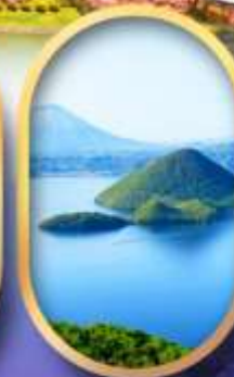
อิวากะทะเลสาบโทโยะ