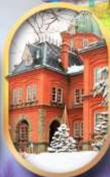
ศาลาว่าการฮอกไกโด