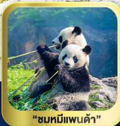
“ชมหมีแพนด้า”