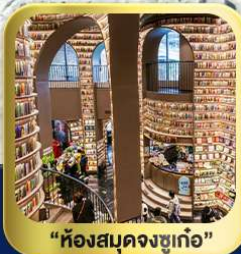
“ห้องสมุดจงชู่เก๋อ”