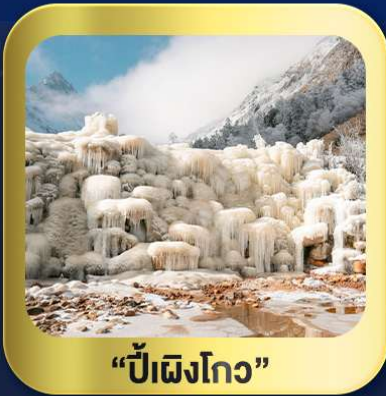
“ปี้ฝิงโกว”

นั่งกระเช้าชมวิว ภูเขาหิมะต้ากู่กลาเซียร์ • ชมความสวยงาม ณ อุทยานปี้ฝิงโกว ห้องสมุดจงชู่เก๋อ • ศูนย์หมีแพนด้า • ตงเจียวจี้ • ซอยกว้างชวยเคบ