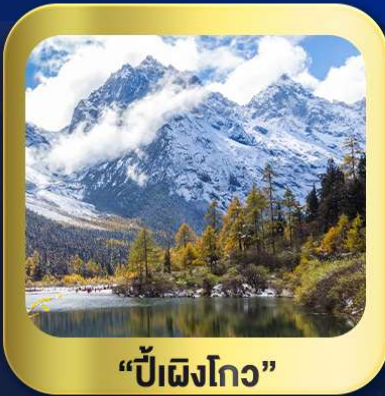
“ปี้ฝิงโกว”