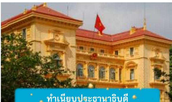
ทำเนียบประธานาธิบดี