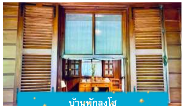
บ้านพักลุงโฮ