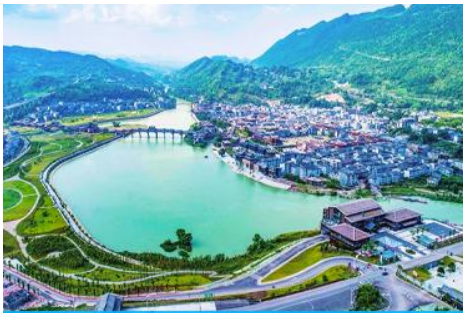
เมืองโบราณจั่วซู่ย

เที่ยง รับประทานอาหารกลางวัน ณ ภัตตาคาร (5)