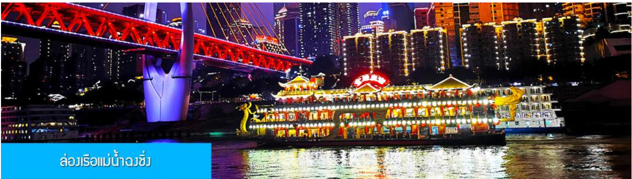
ล่องเรือแม่น้ำวงซี

อิสระอาหารมือเย็น เพื่อสะดวกในการเดินเที่ยว ช้อปปิ้ง และชิมอาหารพื้นเมืองกามอ๋ยฮ้าย