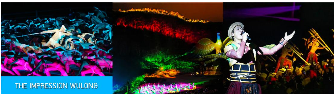
THE IMPRESSION WULONG