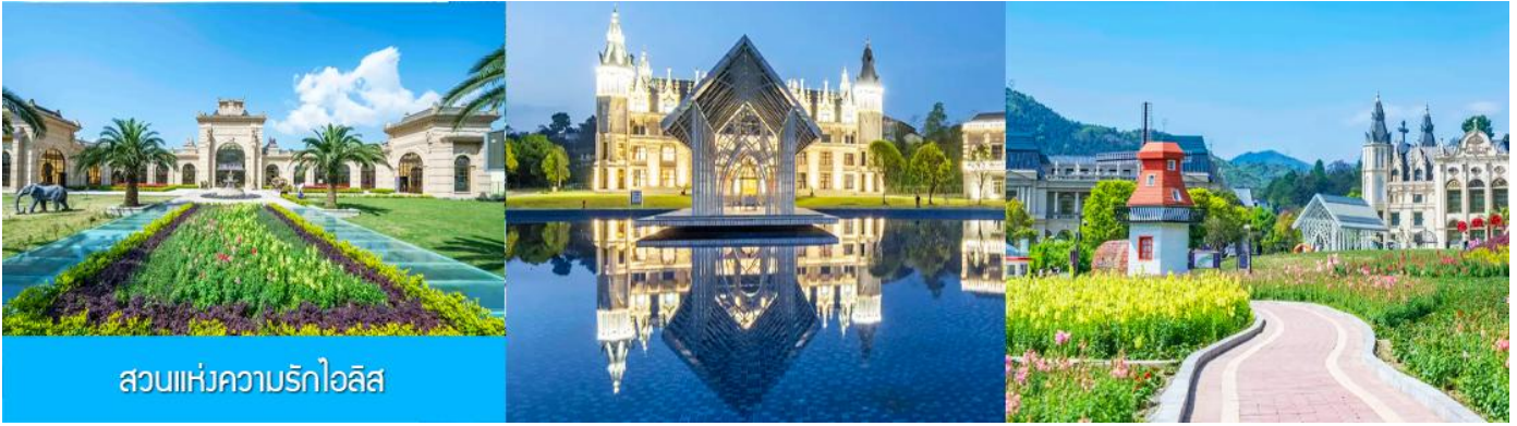
สวนแห่งความรักไอลิส