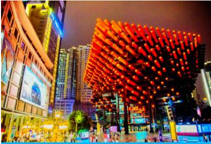
หอศิลป์กั๋วไท่