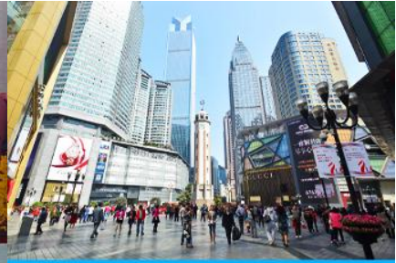
ย่านเจียฟางเปย