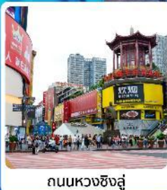
ถนนหวงซิงสู