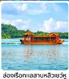
ล่องเรือทะเลสาบหลิวเยวู่