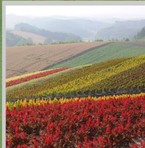
"SHIKISAI NO OKA"