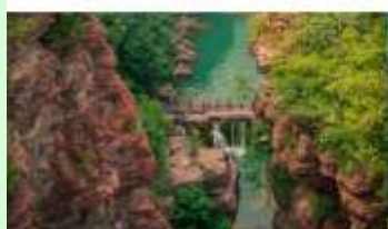
อุทยานสวรรค์หยุนโตซาน