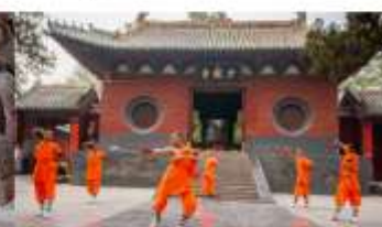
ชมโชว์กังฟูเส้าหลิน

*ทางบริษัทฯ ขอสงวนสิทธิ์ในการสลับโปรแกรมทัวร์ตามความเหมาะสมขึ้นอยู่กับสถานการณ์ประจำวัน โดยคำนึงถึงผลประโยชน์ของลูกค้าเป็นสำคัญ