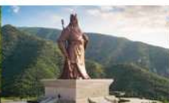
บ้านเกิดกวนอู