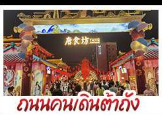
ถนนคนเดินต้าถิง