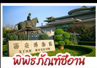
พิพิธภัณฑ์ซีอาน