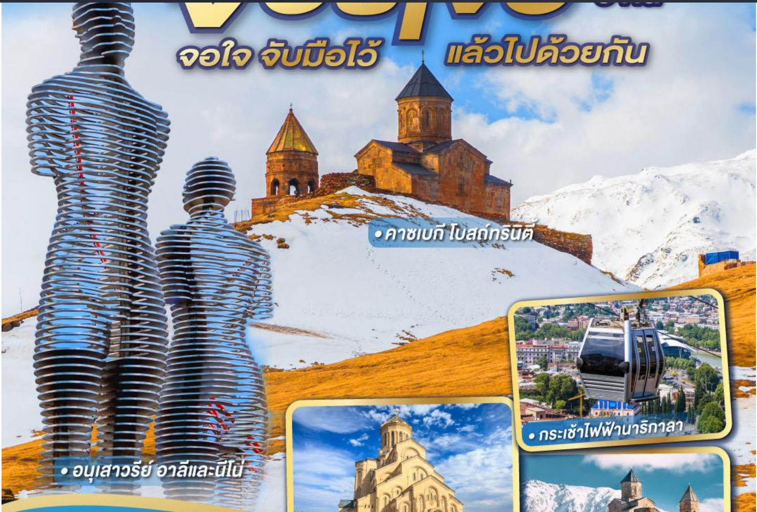
•อนุสาวรีย์ อาลีและนีโน่