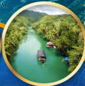
ล่องเรือแม่น้ำโลบ็อก