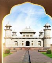
ถ้ำมาฆาลน้อย