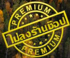
หาดห้าสี