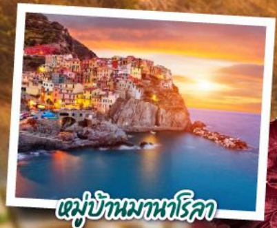
หมู่บ้านมามาโรคา