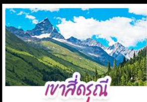
เขาสี่ดรุณี