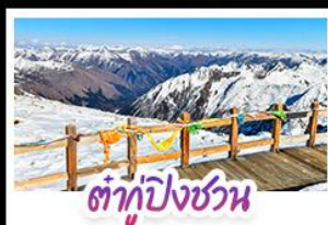
ต้ากู่ปิงชว่น