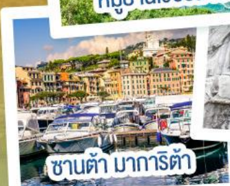
ซานต้า มารีตา