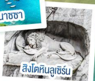
สิงโตหินลูเซิร์น