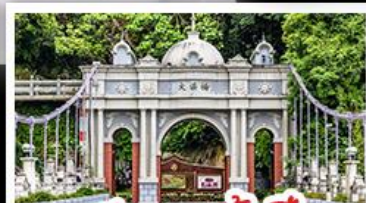
สะพานต้าซี