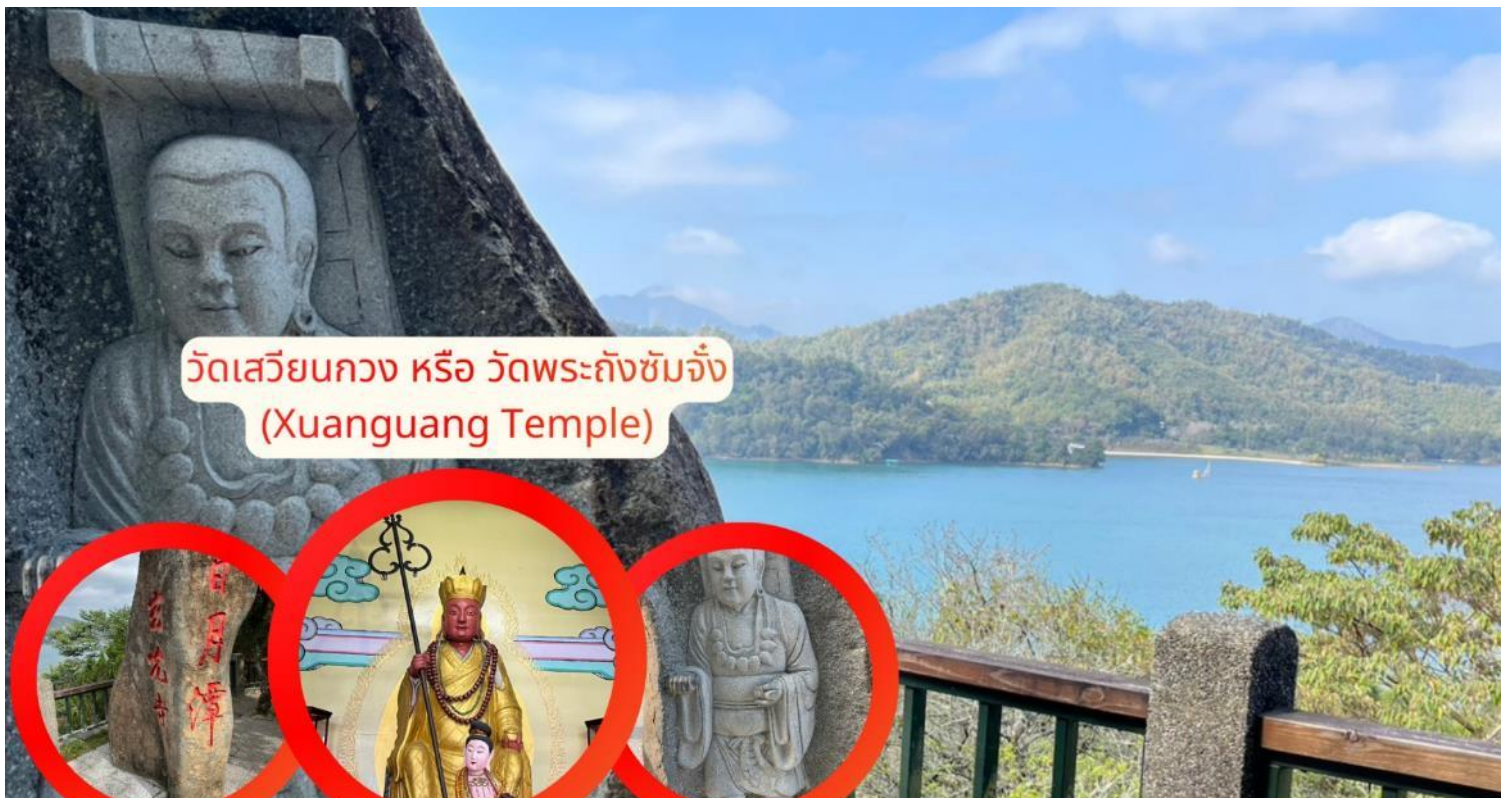
วัดเสวียนกวง หรือ วัดพระถังซัมจั๋ง (Xuanguang Temple)

จากนั้นนำท่านเดินทางสู่ วัดเสวียนกวง หรือ วัดพระถังซัมจั๋ง (Xuanguang Temple) ริมทะเลสาบสุริยันจันทรา สัมผัสความงดงามของ วิวทะเลสาบสุริยันจันทรา พร้อมสักการะเพื่อ เสริมสิริมงคลด้านการเรียนและการงาน ที่วัดพระถังซัมจั๋ง สถานที่ศักดิ์สิทธิ์และเต็มไปด้วย สถาปัตยกรรมจีนดั้งเดิม และประติมากรรมที่สื่อถึงตำนานพระถังซัมจั๋ง เพลิดเพลินกับบรรยากาศสงบ ริมทะเลสาบ เหมาะกับการถ่ายภาพและพักผ่อนจิตใจ