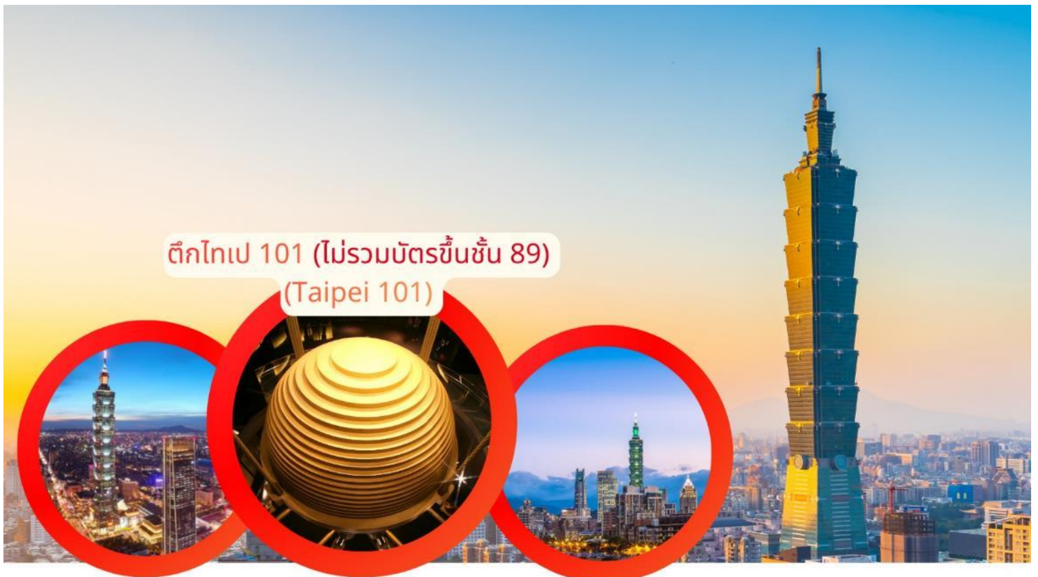
ตึกไทเป 101 (ไม่รวมบัตรขึ้นชั้น 89) (Taipei 101)

เดินทางกลับสู่ กรุงเทพฯ แวะชม ตึกไทเป 101 (ไม่รวมบัตรขึ้นชั้น 89) แต่สามารถถ่ายภาพและชมสถาปัตยกรรมสูงเด่น ที่ถือเป็นสัญลักษณ์ของเมืองและความทันสมัยของไต้หวัน