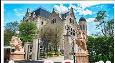
ปราสาทช็อกโกแลตนี้น่า