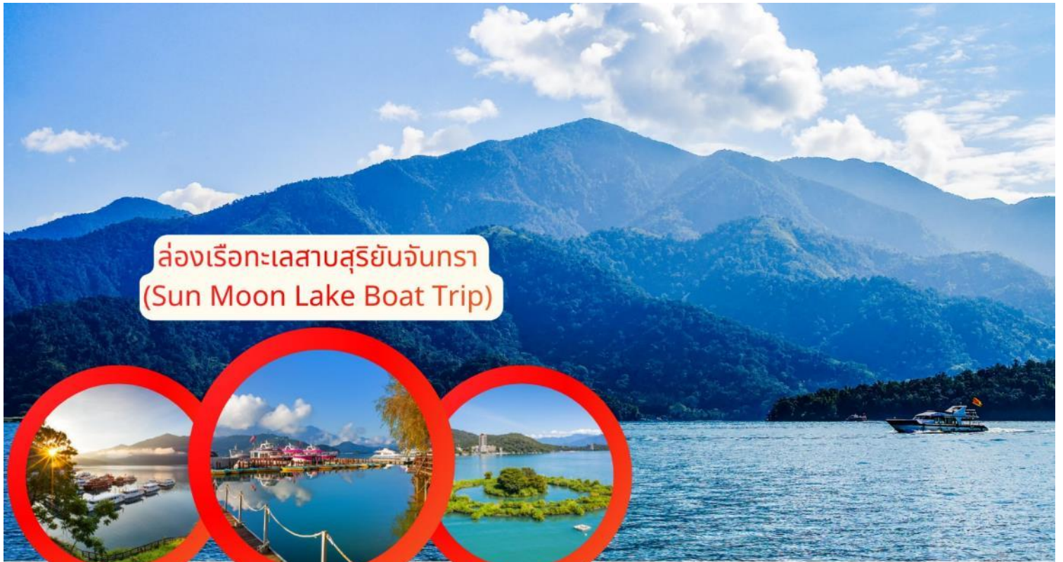
ล่องเรือทะเลสาบสุริยันจันทรา (Sun Moon Lake Boat Trip)

จากนั้นนำท่านเดินทางสู่ วัดเสวียนกวง หรือ วัดพระถังซัมจั๋ง (Xuanguang Temple) ริมทะเลสาบสุริยันจันทรา สัมผัสความงดงามของ วิวทะเลสาบสุริยันจันทรา พร้อมสักการะเพื่อ เสริมสิริมงคลด้านการเรียนและการงาน ที่วัดพระถังซัมจั๋ง สถานที่ศักดิ์สิทธิ์และเต็มไปด้วย สถาปัตยกรรมจีนดั้งเดิม และประติมากรรมที่สื่อถึงตำนานพระถังซัมจั๋ง เพลิดเพลินกับบรรยากาศสงบ ริมทะเลสาบ เหมาะกับการถ่ายภาพและพักผ่อนจิตใจ