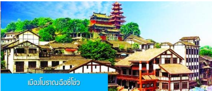
เมืองโบราณฉือชี่โจว

พักที่ HOLIDAY INN EXPRESS HOTEL โรงแรมระดับ 4 ดาวหรือเทียบเท่าในเมืองฉางชิ่ง