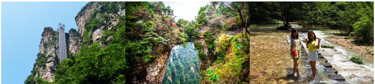
ลิฟท์แก้วไปหลง

หลังอาหารนำท่านเดินทางสู่ อุทยานแห่งชาติจางเจียเจี้ย 张家界森林公园 นำท่านโดยสารรถบัสของเขตอุทยานไปยัง สถานีลิฟท์แก้วไปหลง 百龙天梯 ให้ท่านโดยสารลิฟท์แก้วขึ้นสู่จุดชมวิวในเขตอุทยาน หยวนเจียเจี้ย 袁家界 จุดชมวิวยอดนิยม บนเขาอวตาร ลิฟท์แก้วไปหลง เป็นลิฟท์แก้วชมวิวแบบสองชั้นที่สร้างขึ้นเลียนหน้าผาแนวดิ่งที่มีความสูงราว 325 เมตร เป็น ลิฟท์แก้วชมวิวกลางแจ้งความเร็วสูง ขนาดใหญ่ที่ทำลายสถิติกินเนสบุ๊ค.....ท่านจะตื่นตาตื่นใจกับทัศนียภาพบนเขาอวตาร บนความสูงถึง 1,250 เมตรเหนือระดับน้ำทะเล อาทิ ยอดเขาฮาหลิวยา 哈利路亚山 ภูเขาลอยฟ้าโด่งดังที่เป็นฉากถ่ายทำภาพยนตร์เรื่องอวตาร