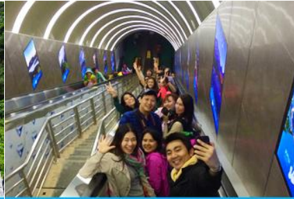
บันไดเลื่อนทะลุภูเขา