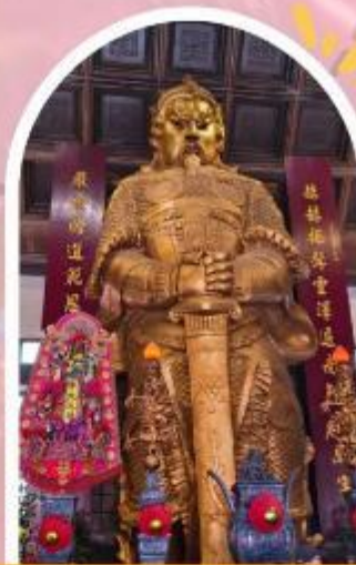
วัดแซกง ขอพรโชคกลาง การเงิน และธุรกิจ