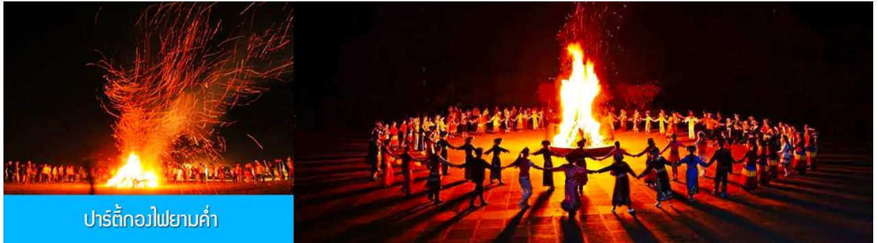
ปาร์ตี้กองไฟยามค่ำ