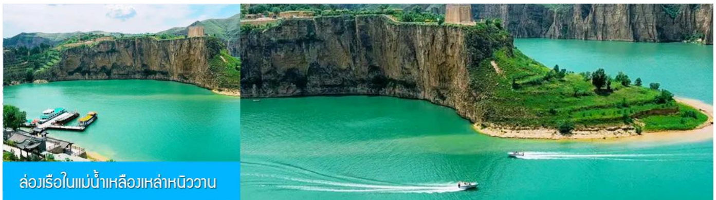
ล่องเรือในแม่น้ำเหลืองเหล่าหนิววาน

เที่ยง รับประทานอาหารกลางวัน ณ ร้านอาหารระหว่างทาง (8)