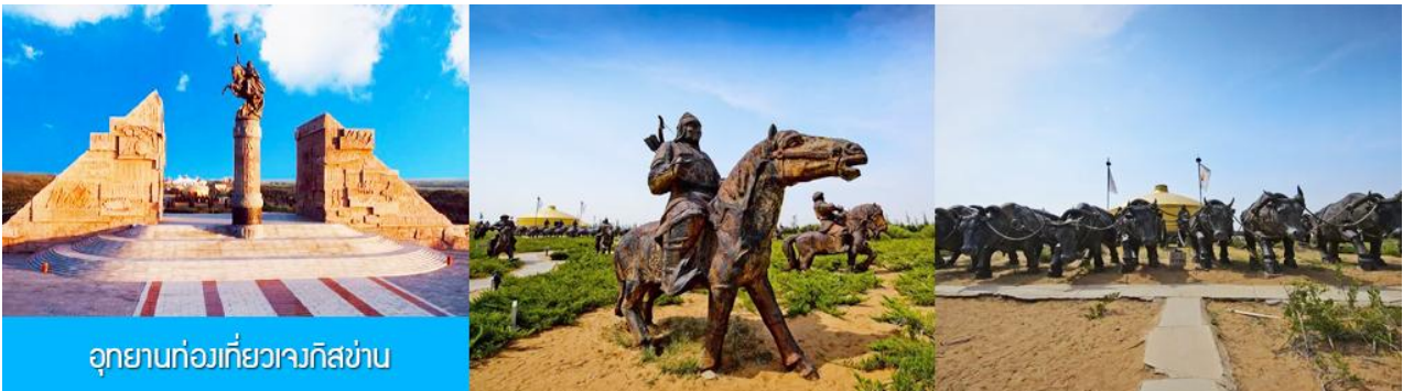
อุทยานทองเทียวเจงกิสข่าน

รับประทานอาหารกลางวัน ณ ร้านอาหารพื้นเมืองในเขตอุทยาน (11)