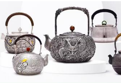
พิพิธภัณฑที่เครื่องปั้นบอโกล