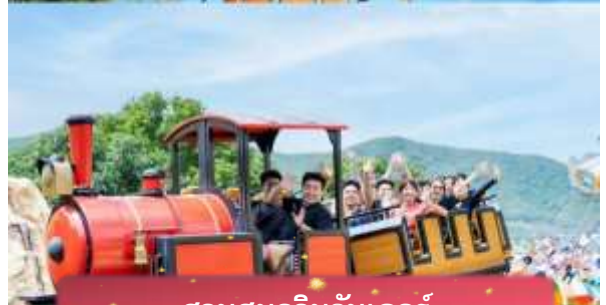
สวนสนุกวินวันเดอร์