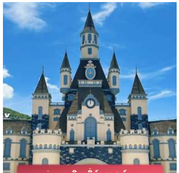
เกาะวินเพิร์ลแลนด์

เที่ยง บริการอาหารกลางวัน ณ ภัตตาคาร พิเศษ ... เมนูบุฟเฟต์บนเกาะ