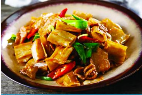
ถนนคนเดินเออร์ดอส

นำท่านเที่ยวชม สวนวัฒนธรรมหมงกู่หยวนหลิว 蒙古源流 เป็นอุทยานท่องเที่ยวเชิงประวัติศาสตร์และวัฒนธรรมระดับ 4A ของจีน ที่เป็นต้นกำเนิดของชนชาติและวัฒนธรรมมองโกล สะท้อนความเป็นจักรวรรดิที่ยิ่งใหญ่เมื่อ 700 ปีก่อน ชม ประตูงเทียน 崇天门 สุคมโหฬารที่แสดงถึงความยิ่งใหญ่ของจักรวรรดิมองโกล ชม จัตุรัสเถิงเก้อหลี่ 腾格里广场 จัตุรัสกลางแจ้งขนาดใหญ่ที่ใช้ประกอบพิธีกรรมต่าง ๆ