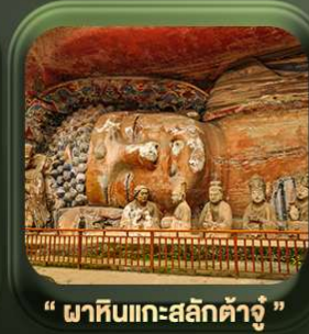
“ พาทินแกะสลักต้าจู่ ”