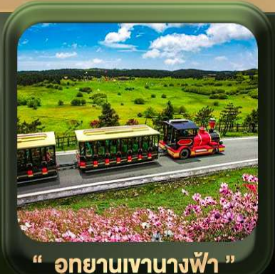
“ อุทยานเขานางฟ้า ”

T2G-CKG26CZ Special of Chongqing...วงชิง ต้าจู่ อุโมงค์ อุทยานหลุมฟ้า เขานางฟ้า 5D 3N (CZ)