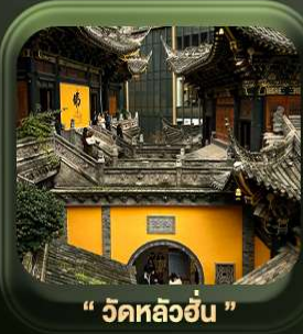
“ วัดหลิวอัน ”