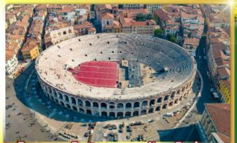
โรงละครโรมันกลางจัหวัดโรม