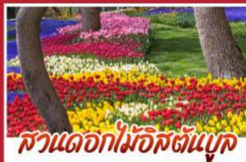
สวนดอกไม้ฮิสตันบุค