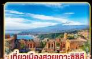
เที่ยวเมืองสวยเกาะซิซิลี Taormina