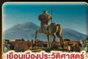
เยือนเมืองประวัติศาสตร์ ปอมเปอี