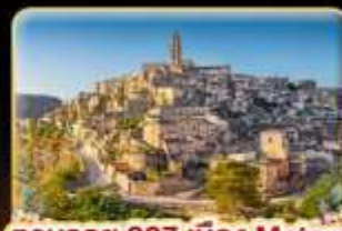
ตามรอย 007 เมือง Matera