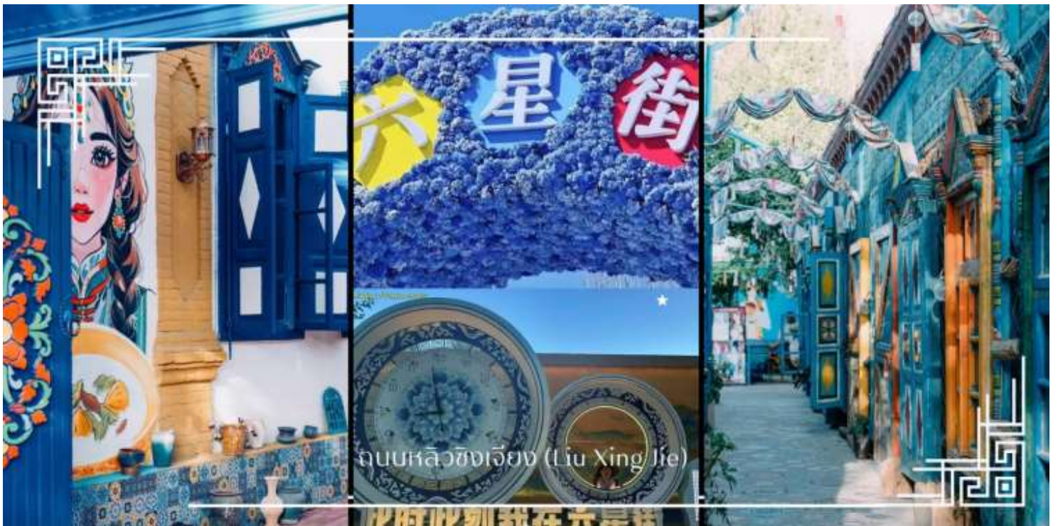
ถนนหลิวซิงเจียง (Liu Xing Jie)

อิสระช้อปปิ้ง ถนนหลิวซิงเจียง (Liu Xing Jie) เมือง อี้หนิง (Yining) ถนนคนเดินที่มีชีวิตชีวาและเต็มไปด้วยสินค้าหลากหลาย เหมาะสำหรับการเดินเล่น ช้อปปิ้ง และสัมผัสบรรยากาศท้องถิ่นอย่างใกล้ชิด สองข้างทางเรียงรายด้วยร้านค้าของฝาก งานหัตถกรรมพื้นเมือง เสื้อผ้า เครื่องประดับ อาหารท้องถิ่น และร้านกาแฟบรรยากาศอบอุ่น โดดเด่นด้วยสถาปัตยกรรมสีสันสดใสที่ผสมผสานกลิ่นอายยุโรปและเอเชียกลางได้อย่างลงตัว