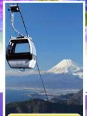
อิซุพานรามาวิว

ออนเซ็น 1 คั้น นน.กระบ่า 23 กก. 7Days 4Night