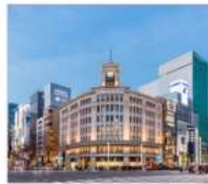
กินข้า้ออปปิ้ง