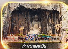
กำแพงหล่งเหมิน