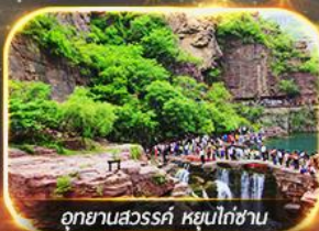
อุทยานสวรรค์ หุ่นโก่ซ่าน