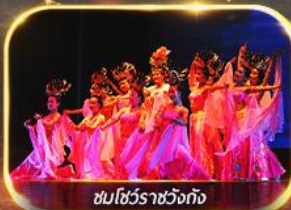
ชมโชว์ราชวงศ์ถัง

นั่งรถไฟความเร็วสูง ย้อนประวัติศาสตร์อันยิ่งใหญ่ "กองทัพทหารจินซี" สัมผัสความงามอุทยานสวรรค์ พิเศษ!! ชมโชว์ราชวงศ์ถัง เก็บครบทุกไฮไลต์ ซอปปิงจู่จิว ห้าง WU YUE