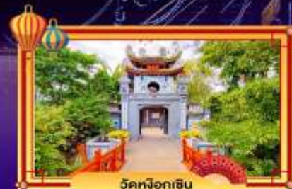
ฝัคน้จ้อฮึน