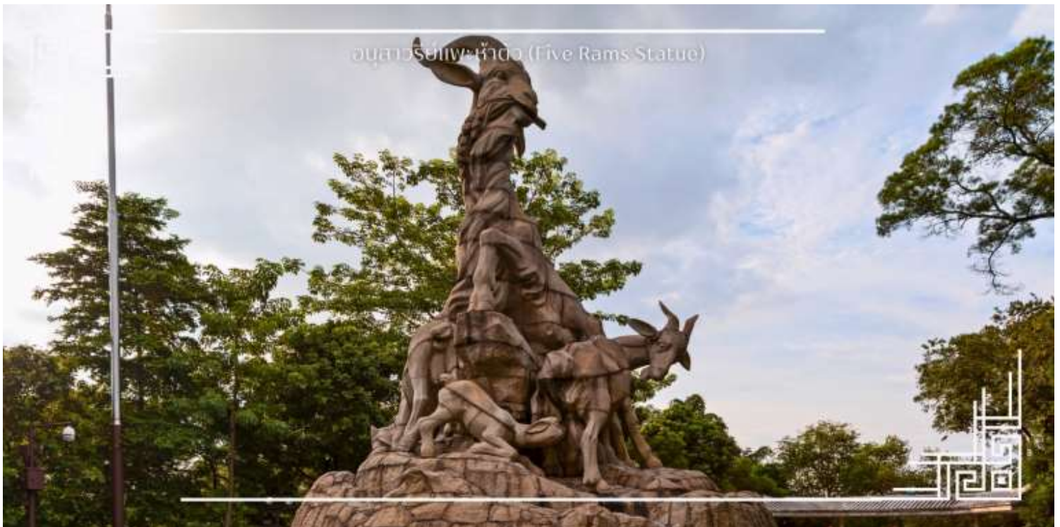
อนุสาวรีย์แพะห้าตัว (Five Rams Statue)

นำท่านถ่ายรูปเช็คอินสวนสาธารณะเยอเซี่ยวซึ่งเป็นสวนสาธารณะขนาดใหญ่ที่สุดในเมืองกวางโจว และนำท่านชมอนุสาวรีย์แพะห้าตัว นับว่าเป็นอีกแลนด์มาร์กกวางโจว สัญลักษณ์ของแพะห้าตัวคาบรวงข้าว 6 รวง เป็นสัญลักษณ์ประจำเมืองกวางโจวมีการแกะสลักด้วยหินแกรนิตอย่างสวยงาม และบริเวณโดยรอบยังมีกิจกรรมการรำไทเก๊กของผู้สูงอายุและคนในชุมชนกวางเจาภายใต้บรรยากาศของสวนสาธารณะที่ร่มรื่น จึงเป็นที่พักผ่อนหย่อนใจได้ทั้งนักท่องเที่ยวและผู้คนในกวางโจวได้ดีเลยทีเดียว