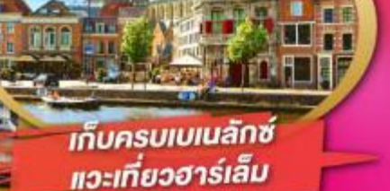
เก็บครบเบเนลักซ์ แวะเที่ยวฮาร์เล็ม